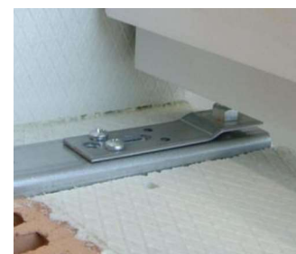
Ilustracja 46: Skręcić element regulacyjny z konsolą SL