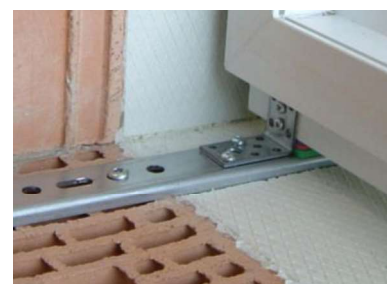
Ilustracja 43: Wyrównać okno, wykonać oklockowanie i przykręcić do konsoli za pomocą kątownika łączącego