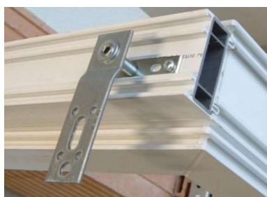
Ilustracja 44: Wstępnie wykonać wstępne otwory w oknie i założyć element regulacyjny