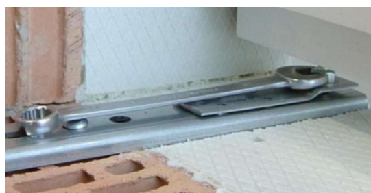
Ilustracja 45: Wyrównać okno na wysokości