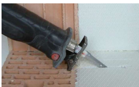
Ilustracja 42: Precyzyjnie wyciąć pozycję zamocowania, wprowadzić konsolę SL i zamocować