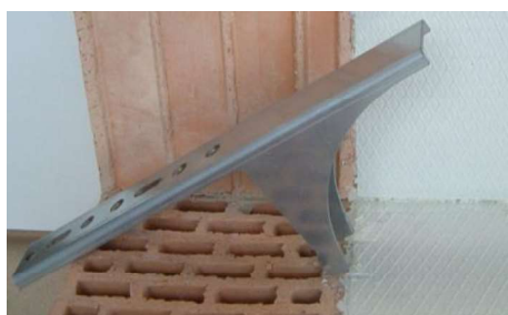
Ilustracja 41: Zaznaczyć pozycję zamocowania